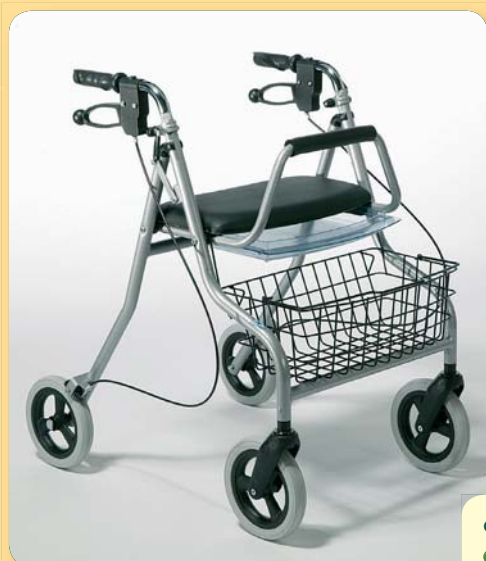
chodítko 275 ● Kód ZP 0011993 ● 3 900,- Kč