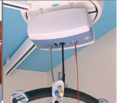
Stropní zvedák FREEWAY