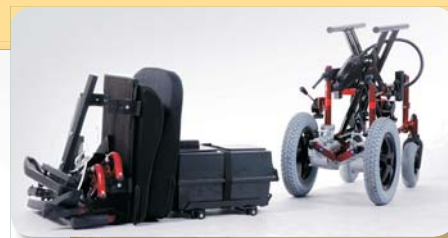
vozík elektrický skládací EXPRESS 2000 ● Kód ZP 0135274 ● 57 420,- Kč