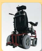
exteriérový vozík elektrický skládací FOREST ● Kód ZP 0135276 ● 104 940,- Kč zavěšení zadních kol na tlumičích