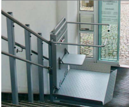
Schodišťová plošina ASCENDOR PLG7