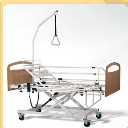
polohovací lůžko PRACTIC ● Kód ZP 0140254 ● 22 680,- Kč