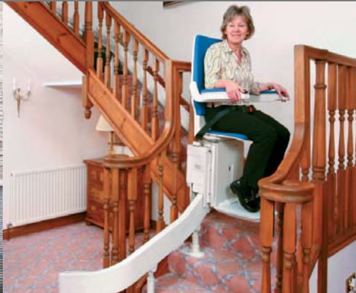
Schodišťová sedačka BISON B80