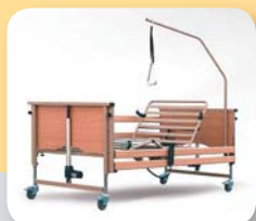
polohovací lůžko Luna BASIC ● Kód ZP 0140253 ● 22 680,- Kč